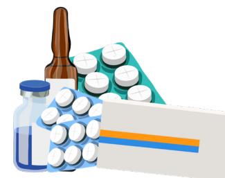
Medicamentos que no necesitas